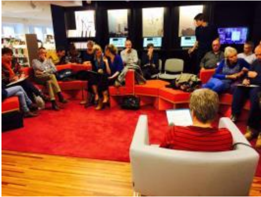
Afbeelding 4 - Literaire luisterquiz tijdens Luisterfestival Zwijgstil.