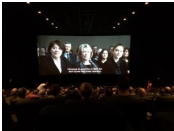
Afbeelding 5 - Première 'Achter de wolken' met audiodescriptie.

audiodescriptie in ons huistijdschrift Knetterende Letteren en op Facebook. Een medewerker van Luisterpunt woonde de voorstelling bij. Cf. SD 2, OD 5, actie 35.