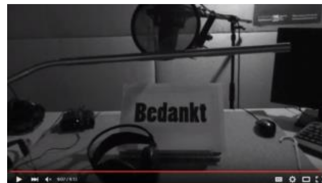
Afbeelding 8 - Bedankingsfilmpje vrijwilligers