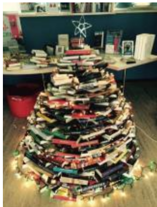
Afbeelding 6 - Foto boekenkerstboom

De meest succesvolle berichten waren een video m.b.t. Music For Life en een foto van onze boekenkerstboom.