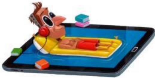
Figuur 1 - Figuur Leo Timmers

Actie 13: Van zodra het online distribueren van Daisy-boeken via anderslezen.be mag, inzetten op de bekendmaking ervan, voeren van promotie hiervoor