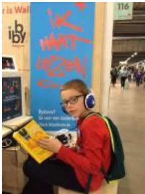
Afbeelding 2 – Jongen beluistert een Daisy-boek op de Boekenbeurs 2015.