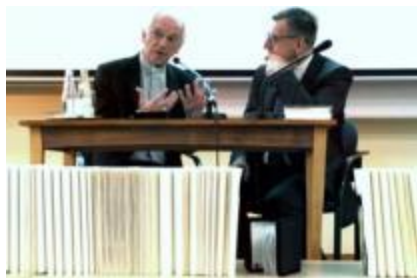
Afbeelding 3 - Bisschop van Brugge Jozef De Kesel en senator Steven Vanackere in gesprek over de Bijbel.