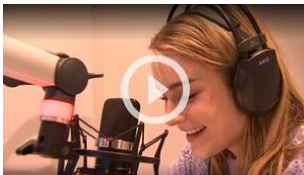
Bekijk de reportage van Karrewiet

Midden januari zijn de 6 Daisy-boeken bij Luisterpunt te verkrijgen. Volg ons op Facebook en Instagram en je weet het als eerste.